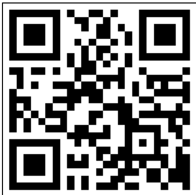
考生健康监督日报二维码

截止12月4日，未报满14天身体健康状况的考生，需持12月2日9:00后（即考试开始前72小时内）公立医院出具的新冠病毒核酸检测阴性报告参加考试。